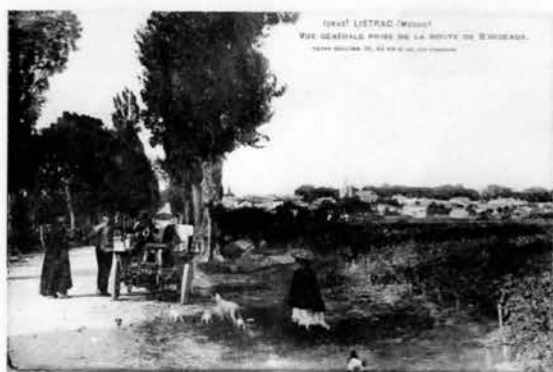
La route de Bordeaux